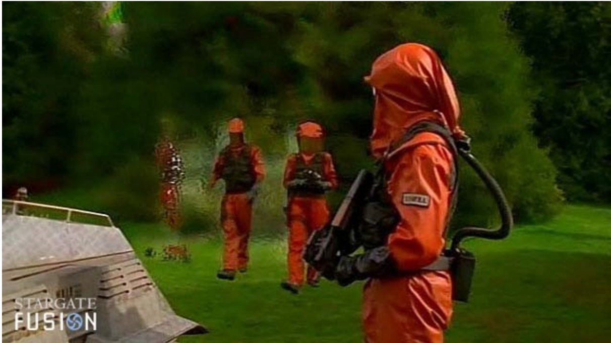
L'équipe SG passe la paroi du dôme et arrive dans le parc.