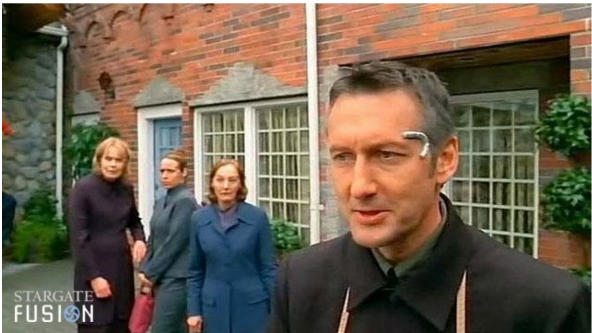
L'interface, bien visible, de Kendrick.