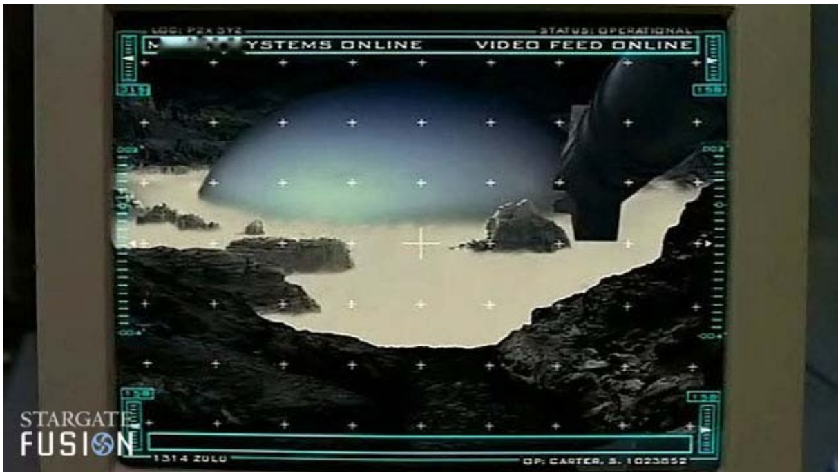
Le dôme, vu par la caméra de la sonde MALP.