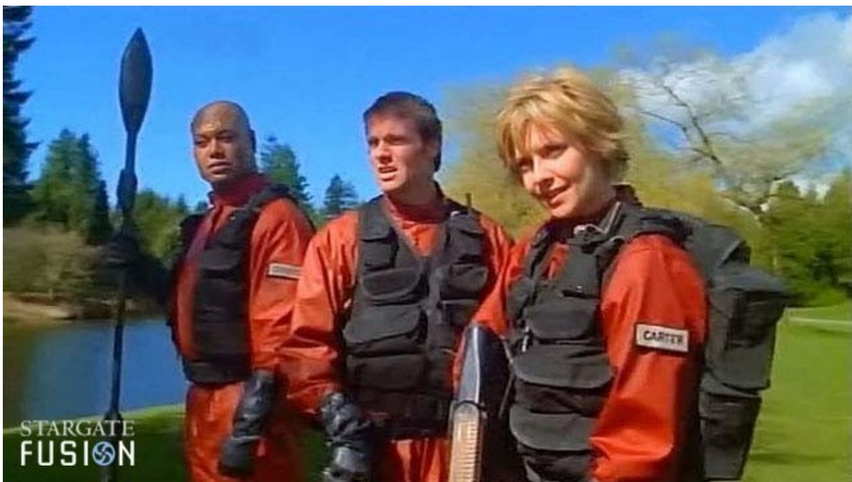
L'air est respirable...