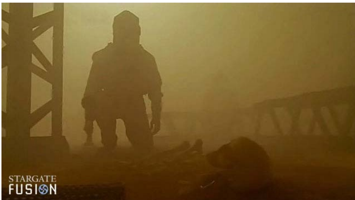
L'extérieur... La découverte du squelette.