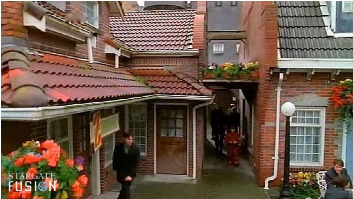
Les habitants du village vaquent à leurs occupations...